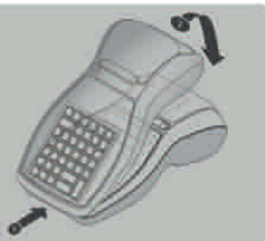
Applicazione del cover di protezione