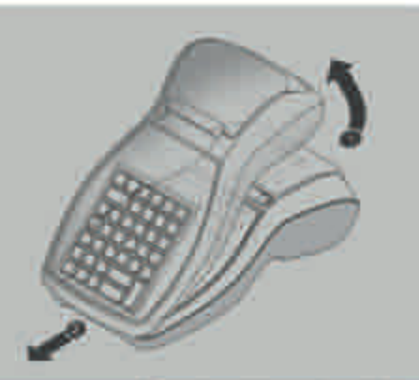
Rimozione del cover di protezione